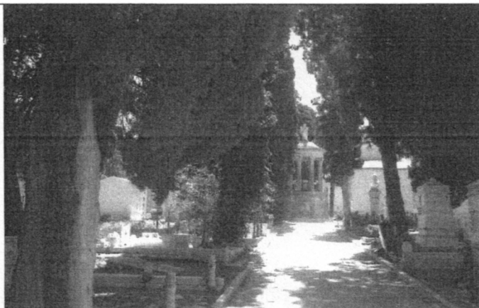
Cimitero Comunale - Ossario